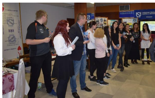
Veletrh vzdělávání - Rakovník

Další prezentační akcí zaměřenou výhradně na technické obory je Veletrh technického vzdělávání v Kladně. Pořadatelem je Okresní hospodářská komora a koná se ve dvou dnech – letos 6. - 7. října 2017. Vzhledem zaměření tohoto veletrhu se zde škola prezentuje s učebními obory Klempíř, Instalátér, Zedník a Operátor skladování.