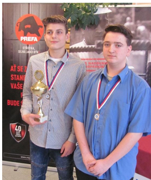
Soutěžící ze Stochova získali druhé místo a postoupili na Mistrovství ČR v Brně