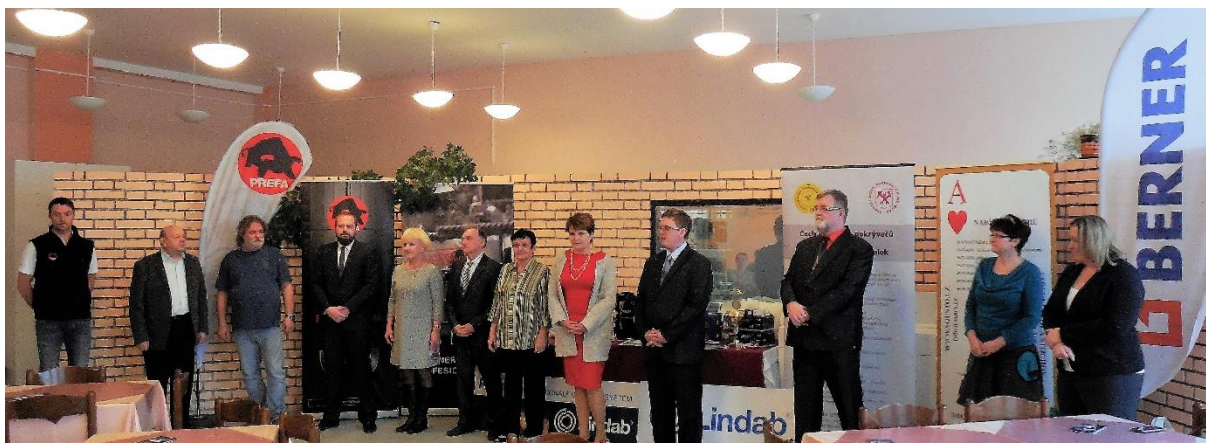
Soutěž klempířů ve Stochově – vyhlášení výsledků

Výsledky Oblastního kola soutěže odborných dovedností ve Stochově: