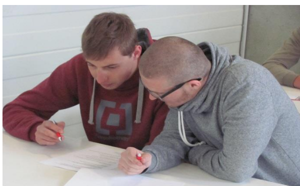
Soutěž instalatérů v Českých Budějovicích – teoretický test

První částí soutěže byl teoretický test složený z 50 otázek, po kterém došlo podle výsledků k rozdělení pracovišť pro praktickou část. Po teoretické části byli naši žáci na třetím místě a mohli si tedy vychutnat pokračování v soutěži a bojovat o vítězství.